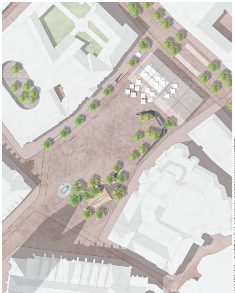
Grafik: SOWATRINI Landschaft mit RB+P Landschaftsarchitektur und christoph hesse architects

Lageplan des Siegerentwurfs von SOWATRINI Landschaft mit RB+P Landschaftsarchitektur und christoph hesse architects, Stand November 2023